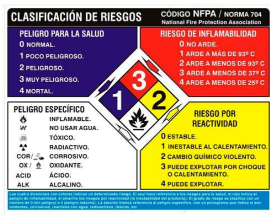
Resumen norma NFPA 704

A continuación en la figura 2 se muestra un resumen de lo anteriormente explicado, en la misma se observan las divisiones, los colores y los grados de riesgos asociados a cada división.