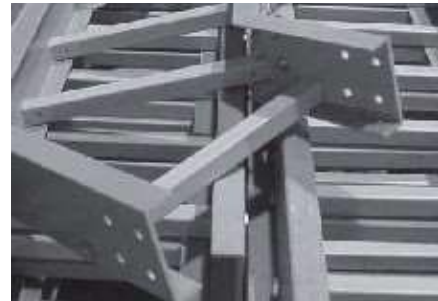
Bandejas de fibra de vidrio

Dependiendo de la carga que representen los cables instalados sobre ella, esto significa que la bandeja portacables de fibra podría colapsar, es decir, pierde la clase de designación bajo norma NEMA VE-1 con la cual fue seleccionada para su aplicación.