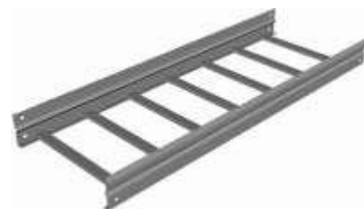
Bandejas de acero galvanizado Figura N° 4

El acero de bajo carbono pierde aproximadamente un 10% de su rigidez a partir de los 430 °C, si la temperatura alcanza los 540 °C la fuerza del acero de bajo carbono disminuye hasta en un 50%